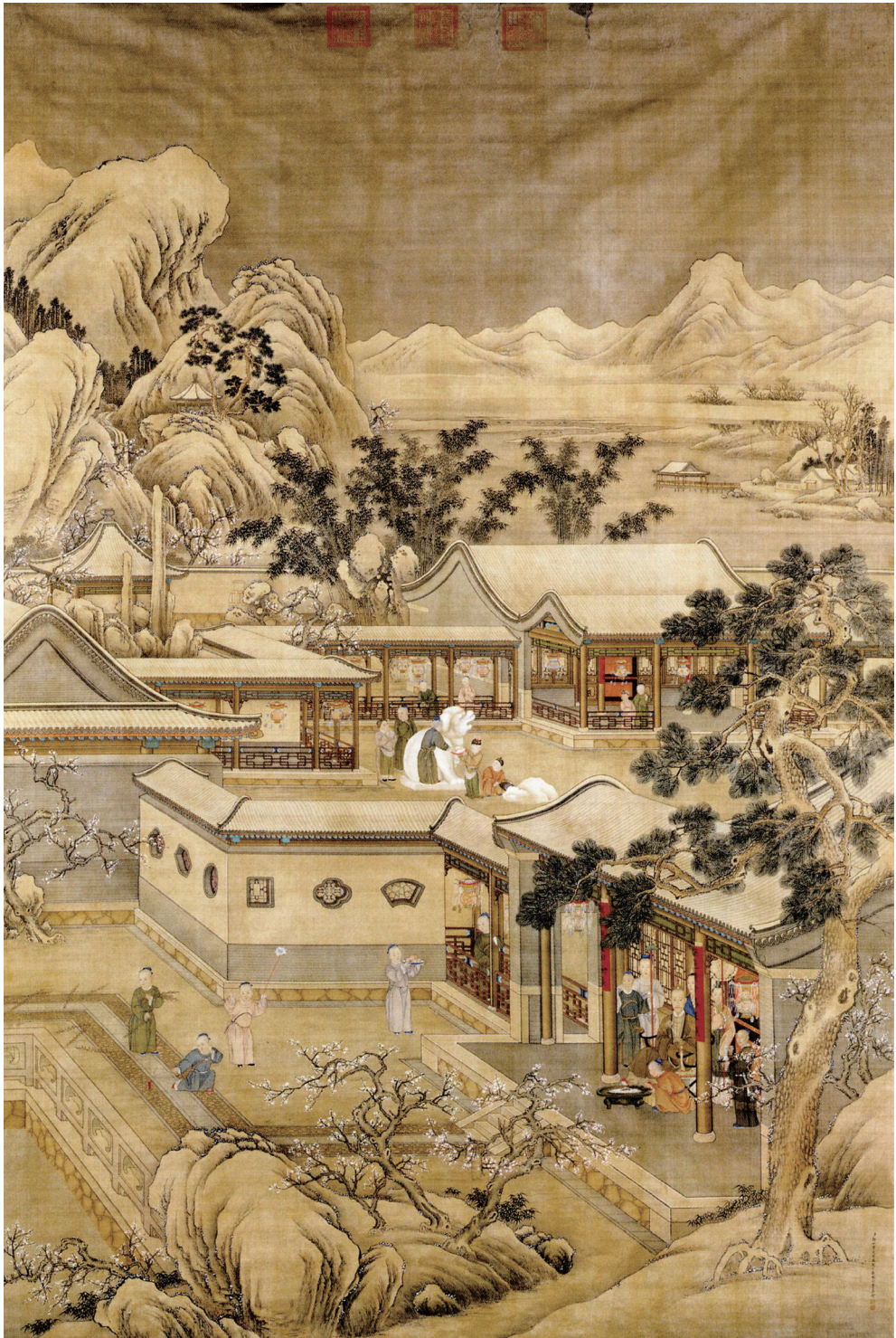
郎世寧（1688—1766）等，《乾隆帝歲朝行樂圖》，約1746，絹本設色，軸，305 x 206公分，北京，故宮博物院；自朱誠如主編，《清史圖典》（北京：紫禁城出版社，2002），第六冊，頁225。