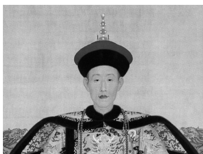
《乾隆帝朝服像》局部 1736