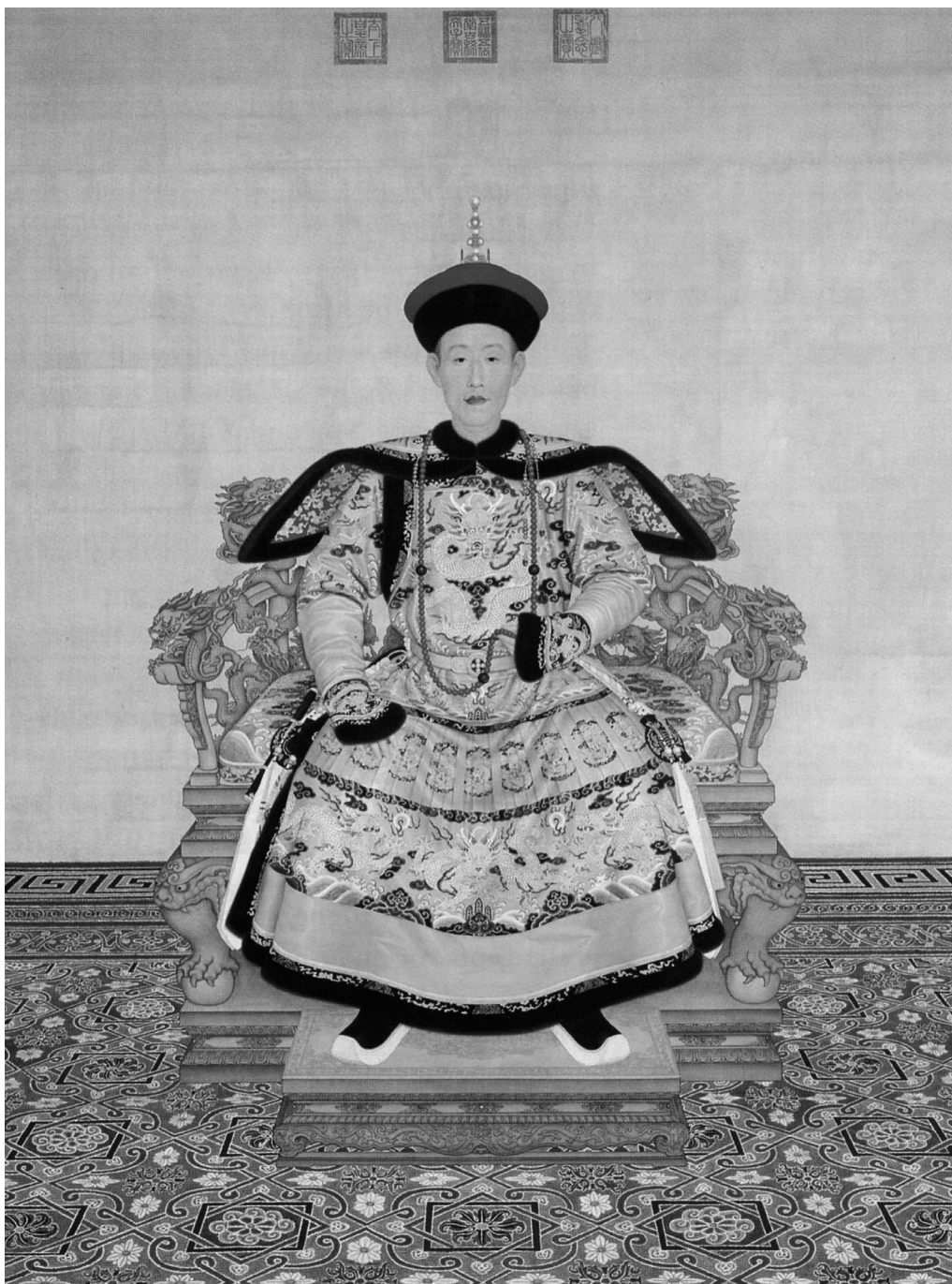
圖9 傳郎世寧（1688—1766）等，《乾隆帝朝服像》，約1735—1736，局部，絹本設色，軸，242 x 179公分，美國，克利夫蘭博物館；自Evelyn S. Rawski and Jessica Rawson, China: The Three Emperors 1662-1795 (London: Royal Academy of Arts, 2006), p. 81.