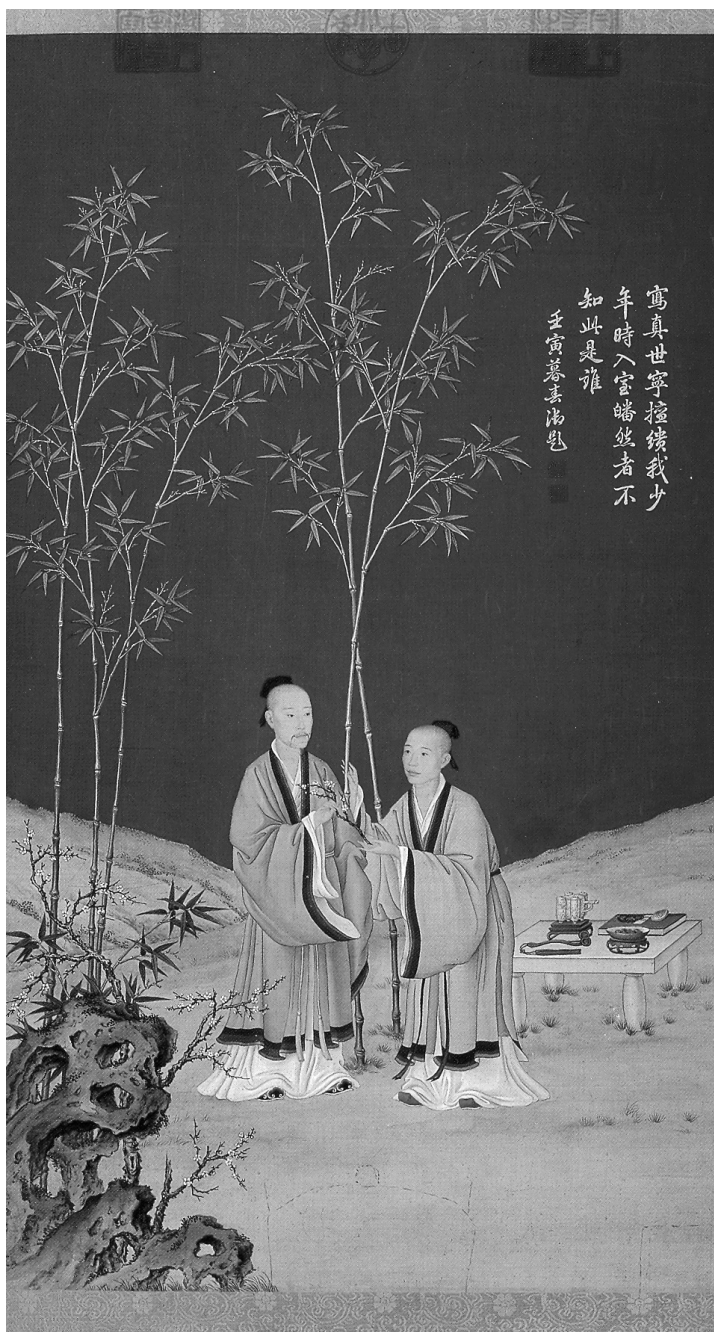
圖12 郎世寧，《平安春信圖》，1722—1735，絹本設色，軸， 68.8 x 40.6公分，北京，故宮博物院藏；攝自聶崇正主編， 《清代宮廷繪畫》（北京：文物出版社，1992），頁103。