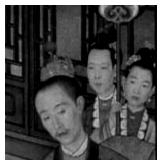
《乾隆帝歲朝圖》局部 1736