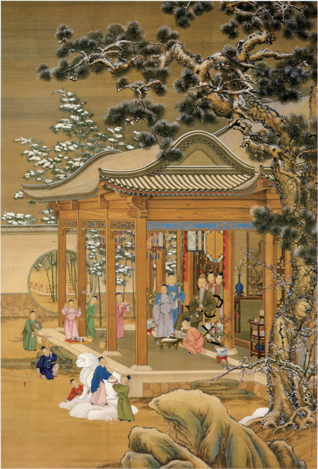
傳郎世寧（1688—1766）等，《乾隆帝雪景行樂圖》，1738，絹本設色，軸，289.5 x 196.7公分，北京，故宮博物院；自聶崇正，《清代宮廷繪畫》（北京：文物出版社，1992），頁107。