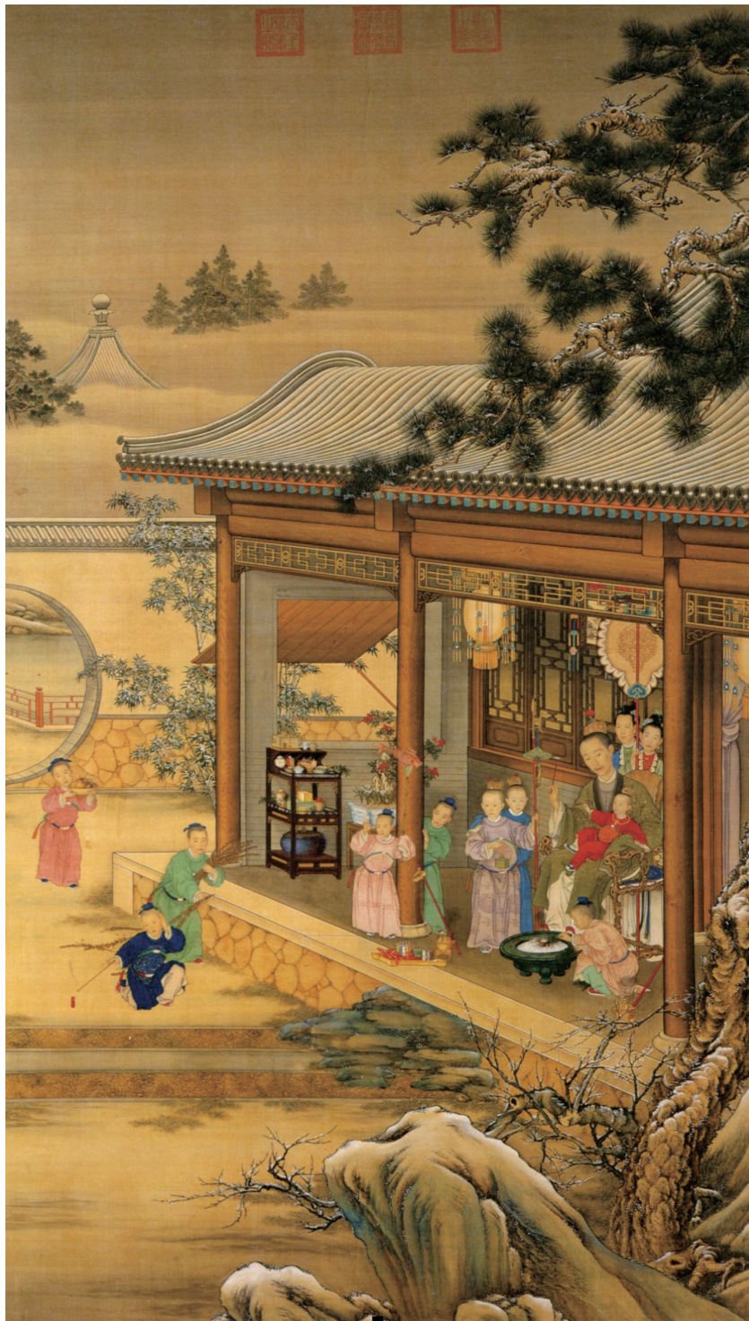
郎世寧（1688—1766）等，《乾隆帝歲朝圖》，約1736，絹本設色，軸，277.7x160.2公分，北京，故宮博物院；自聶崇正，《清代宮廷繪畫》（北京：文物出版社，1992），頁119。