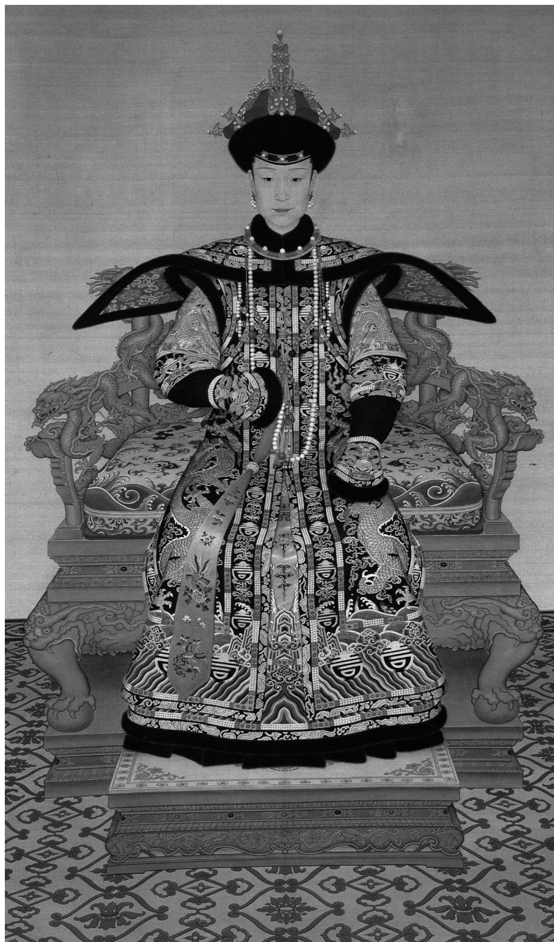
圖13 傳郎世寧（1688—1766）等，《孝賢純皇后朝服像》，約1736—1738，絹本設色，軸，194.8 x 116.2 公分，北京，故宮博物院；自聶崇正，《清代宮廷繪畫》（北京：文物出版社，1992），頁174。