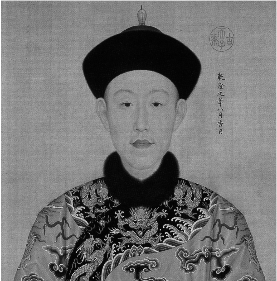
圖10 傳郎世寧(1688—1766)等，《乾隆帝肖像》，約1736，自《心寫治平》，局部，絹本設色，卷，52.9 x 688.3公分，北京，故宮博物院；自 Chuimei Ho and Bennet Bronson, Splendors of China's Forbidden City: The Glorious Reign of Emperor Qianlong (Chicago: Field Museum, 2004), p. 165.