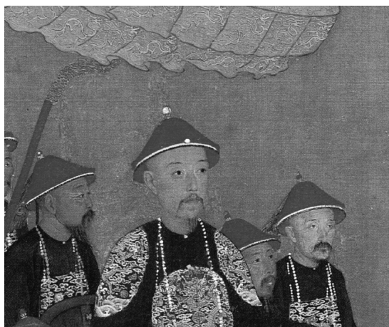
圖7 《萬樹園賜宴圖》局部