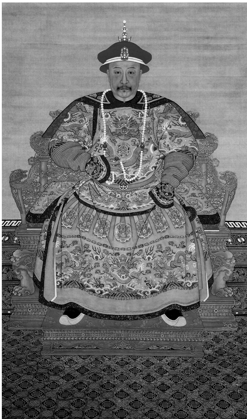
圖16 清人，《嘉慶帝朝服像》，約1796，絹本設色，軸，271 x 141公分，北京，故宮博物院；自朱誠如主編，《清史圖典》（北京：紫禁城出版社，2002），第八冊，頁5。