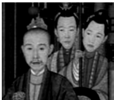
《乾隆帝雪景行樂圖》局部 1738