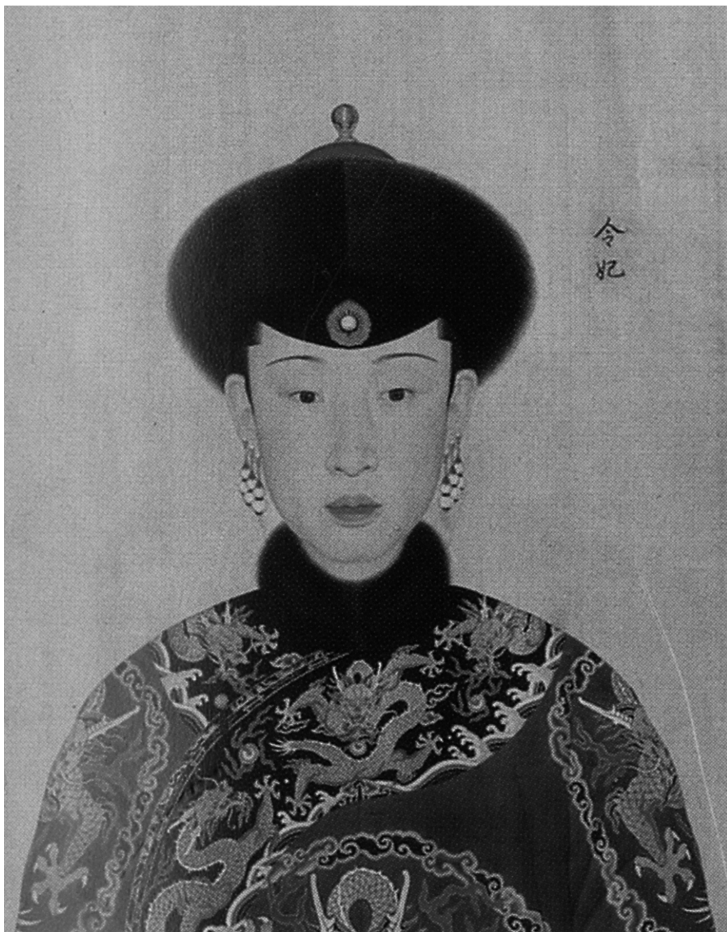
圖14 傳郎世寧(1688—1766)等，《令妃吉服像》，約1761—1765，自《心寫治平》，局部，絹本設色，卷，52.9 x 688.3公分，美國，克利夫蘭博物館；自Chuimei Ho and Bennet Bronson, Splendors of China's Forbidden City: The Glorious Reign of Emperor Qianlong (Chicago: Field Museum, 2004), p. 165.