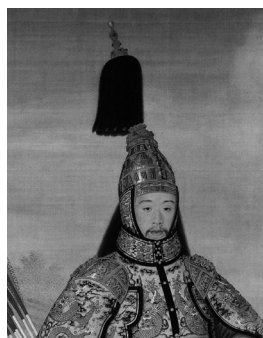
《乾隆帝大閱圖》局部 1739