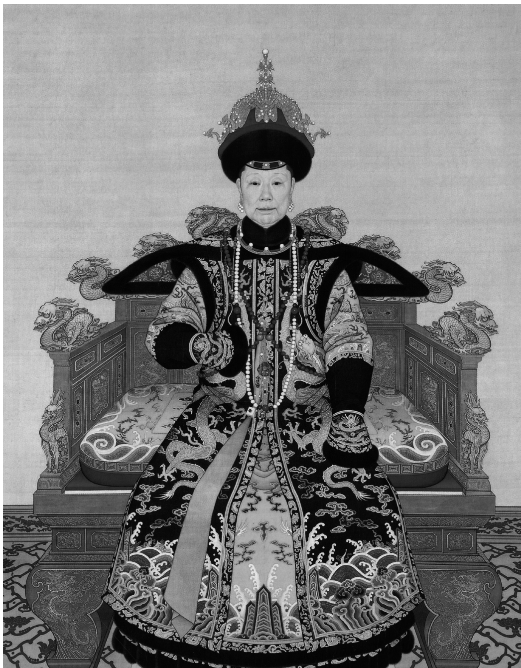
圖15 清人，《孝聖憲皇太后朝服像》，絹本設色，軸，230.5 x 141.3公分，北京，故宮博物院； 自 Evelyn S. Rawski and Jessica Rawson, China: The Three Emperors 1662-1795 (London: Royal Academy of Arts, 2006), p. 75.