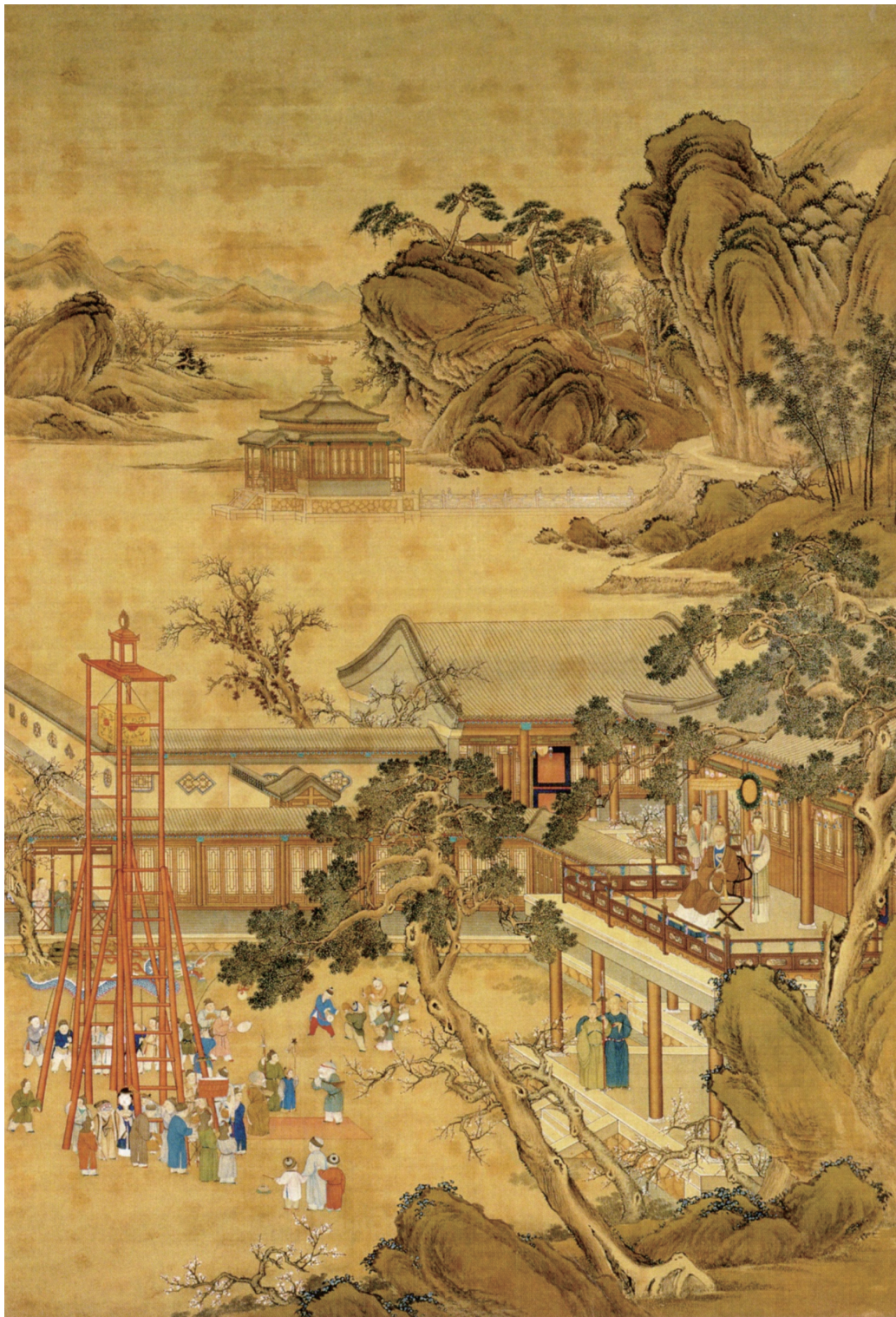
清人，《乾隆帝元宵行樂圖》，約1750—1755，絹本設色，軸，277.7 x 160.2公分，北京，故宮博物院；自朱誠如主編，《清史圖典》（北京：紫禁城出版社，2002），第七冊，頁513。