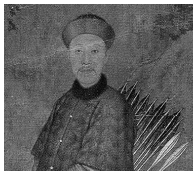
《乾隆帝哨鹿圖》局部 1741