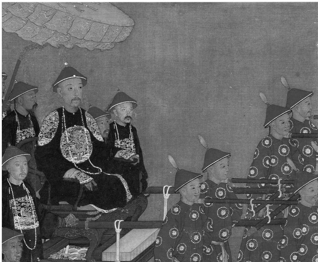
圖6 清人，《萬樹園賜宴圖》局部，1755，絹本設色，卷，221.2x419.6公分，北京，故宮博物院；自聶崇正，《清代宮廷繪畫》（北京：文物出版社，1992），頁118。