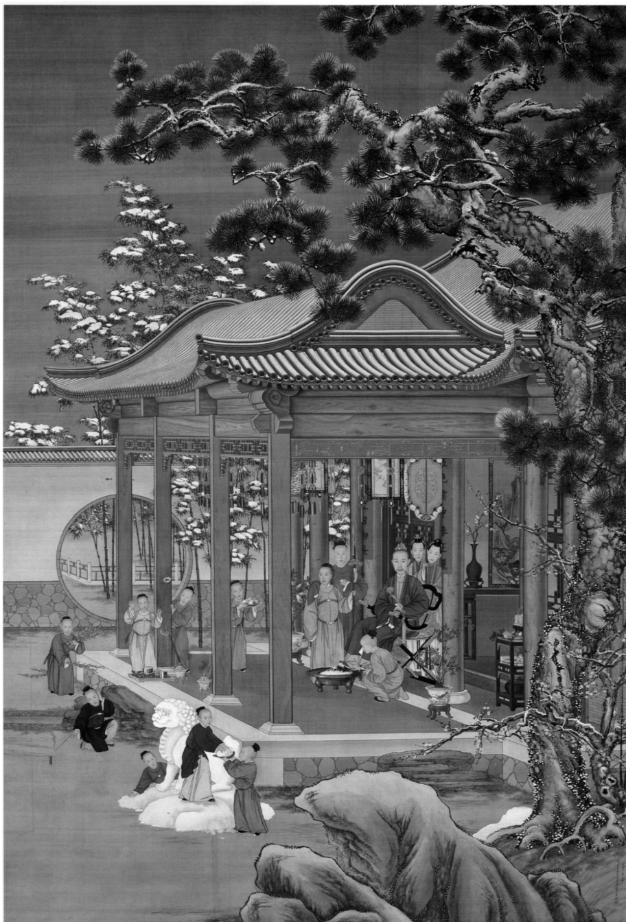
圖2 傳郎世寧(1688—1766)等，《乾隆帝雪景行樂圖》，1738，絹本設色，軸，289.5 x 196.7公分，北京，故宮博物院；自聶崇正，《清代宮廷繪畫》（北京：文物出版社，1992），頁107。