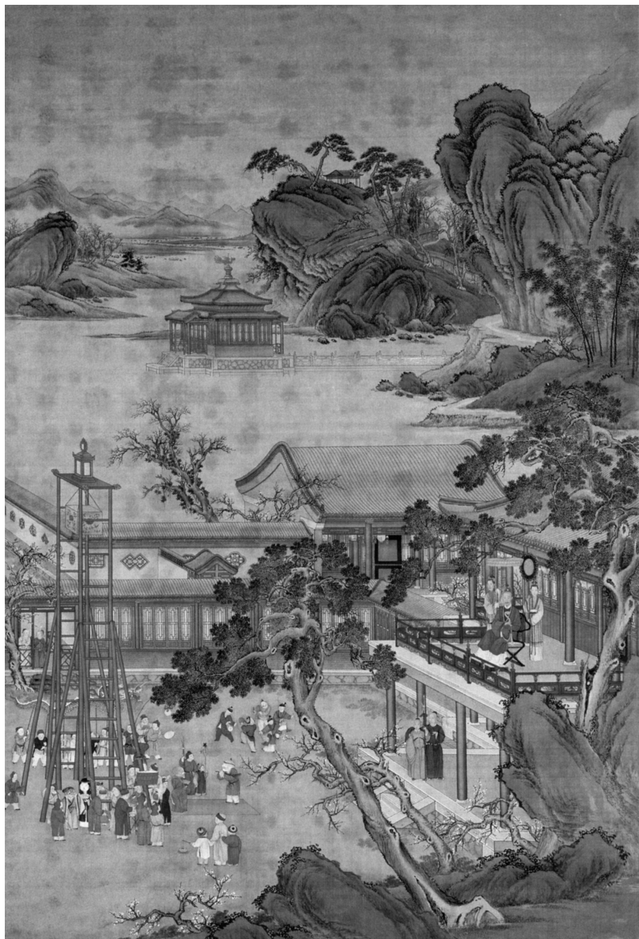
圖4 清人，《乾隆帝元宵行樂圖》，約1750—1755，絹本設色，軸，277.7 x 160.2公分，北京，故宮博物院；自朱誠如主編，《清史圖典》（北京：紫禁城出版社，2002），第七冊，頁513。